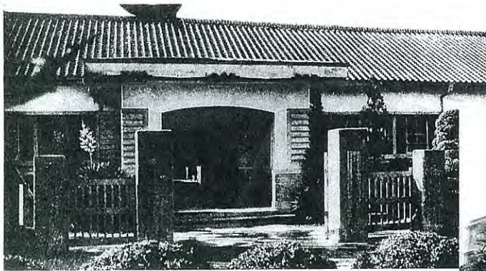
「藤枝高等学校」時代の西教場 (現藤枝西高)