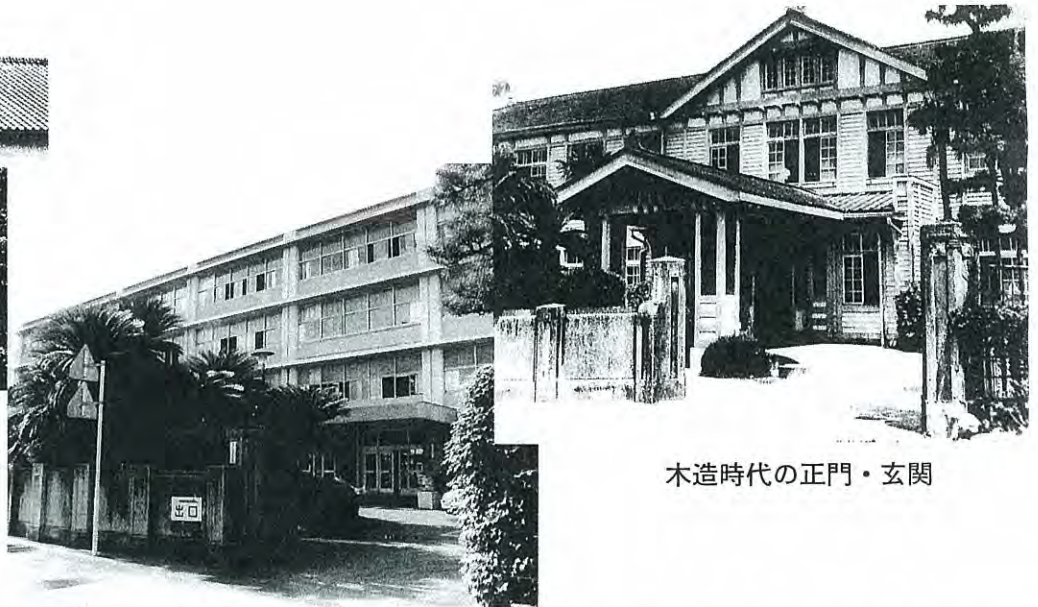
木造時代の正門・玄関