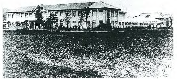
創立の頃、正門前の畑から